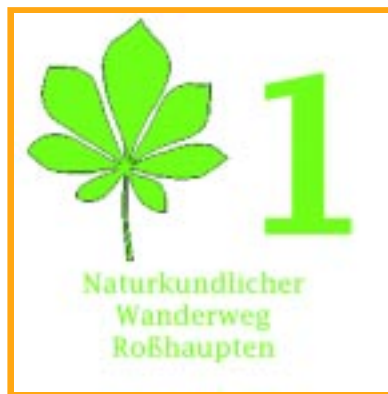
Beschilderung der Erlebnispunkte

Es liegt an uns allen, nicht nur an den Förstern und Waldbesitzern, daß unser Wald seine Vitalität zurückgewinnt und bei nachhaltiger Bewirtschaftung die für uns unverzichtbaren Funktionen erfüllen kann. Wir alle sollten mithelfen, daß auch in Zukunft der Wald ein schönes und unersetzbares Element unserer Heimat bleibt.